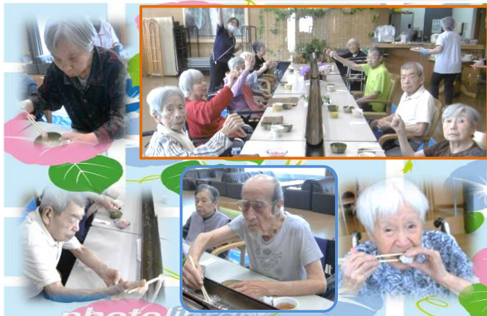
特別養護老人ホーム明星

6月10日、11日、12日の3日間、特養では4階星徳館にて、流し素麺を開催しました。