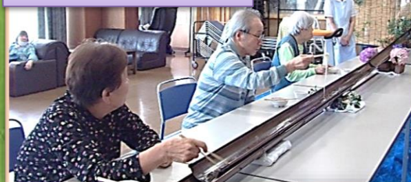
軽費老人ホーム明星

各フロアから10名程、各曜日に参加されました。参加者の中には、わさびを持参し自分好みのつゆを作ったり、まとまった素麺が流れてくるたびに「チャンス!」と大きな声で言われて、楽しそうに参加されていました。