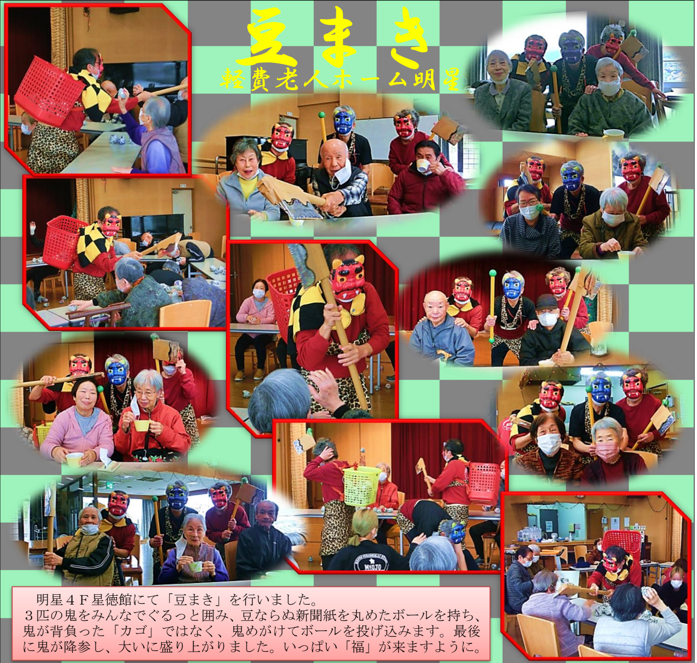
明星4F星徳館にて「豆まき」を行いました。 3匹の鬼をみんなでぐるっと囲み、豆ならぬ新聞紙を丸めたボールを持ち、鬼が背負った「カゴ」ではなく、鬼めがけてボールを投げ込みます。最後に鬼が降参し、大いに盛り上がりました。いっぱい「福」が来ますように。